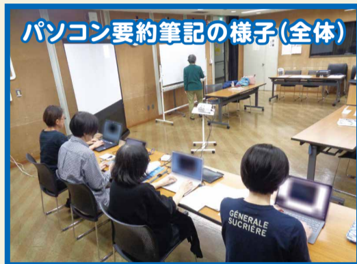
パソコン要約筆記の様子(全体)