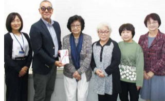
黒岩会長(左から3人目)より、手渡されました。