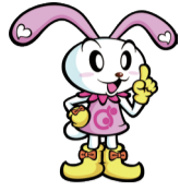
調布市協キャラクター ちょびット