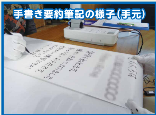
手書き要約筆記の様子(手元)