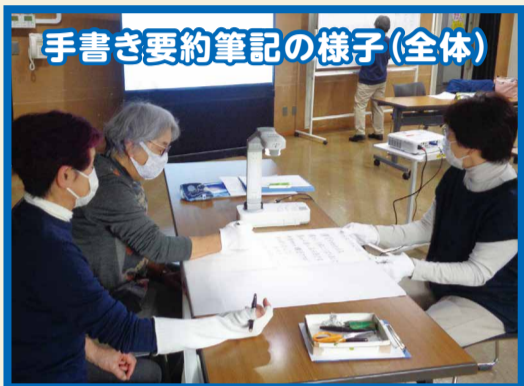
手書き要約筆記の様子(全体)

要約筆記とは、その場で音声情報を要約し、文字化して伝える通訳です。聞こえない聞こえにくい人には情報を得るための大切なコミュニケーション手段のひとつです。手書きやパソコンでの文字入力があり、1対1での要約筆記や、大勢の方を対象に内容をスクリーンに映し出す投影型の要約筆記などがあります。