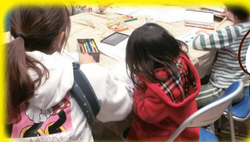
▲ぬりえコーナーでは、みなさん楽しそうに塗っていました。

むらさきホールでは、たくさんのぼくのぬりえを展示したよ! みんな素敵な作品をありがとう!