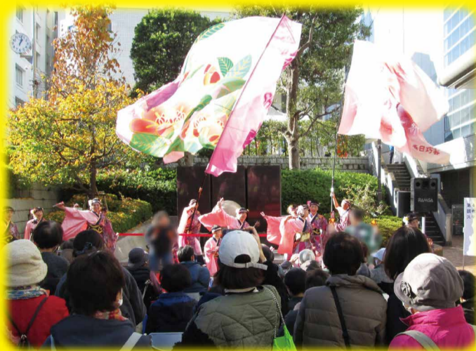
▲迫力のある、よさこいのステージ発表!