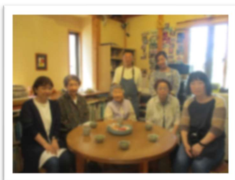
陶芸教室 2階喫茶スペースにて