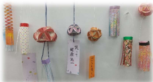
飾りには願いごとの短冊も添えて…