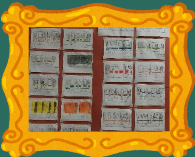
ほんじやう 本場 K.Dさん