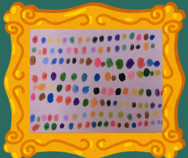
ぶんじやう 分場 T.Sさん