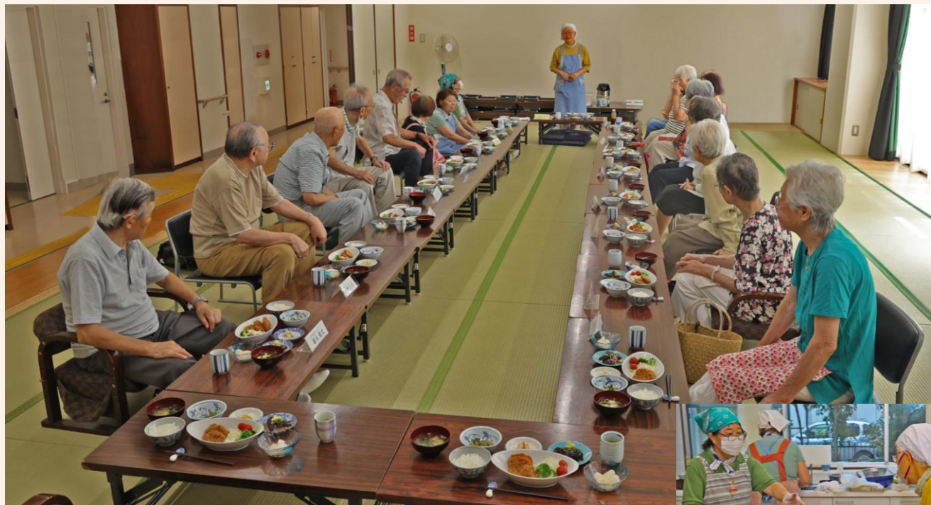
高齢者会食サービスの様子 調理ボランティアも募集中

(令和6年度分の募金の受付は令和7年1月末まで、それ以降は令和7年度分となります。)